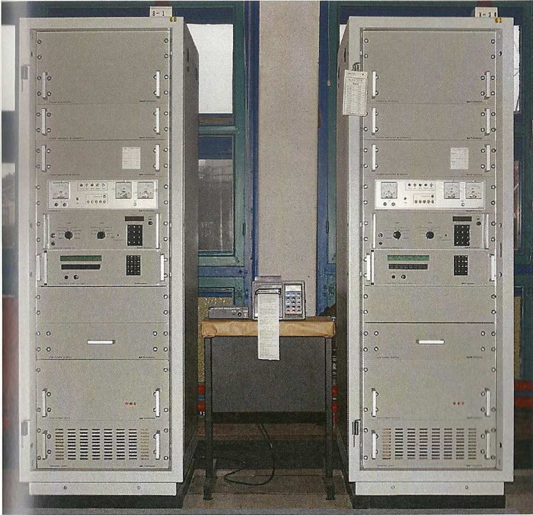
Middelkerke, 2001: NAVTEX-zenders CST 2001 MF